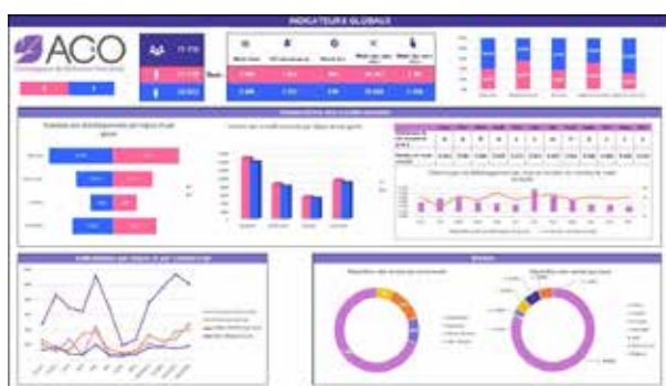
Exemple de tableau de bord construit durant la formation

Maîtriser la fonction RECHERCHEV Maîtriser les Tableaux Croisés Dynamiques (TCD)