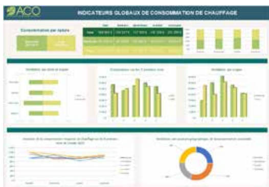
Exemple de tableau de bord construit durant la formation