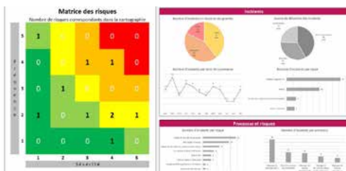
Exemple de tableau de bord construit durant la formation