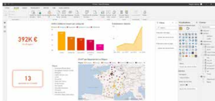
Exemple de tableau de bord construit durant la formation

Dernière version de Power BI installée sur un ordinateur comportant 8 Go de RAM minimum