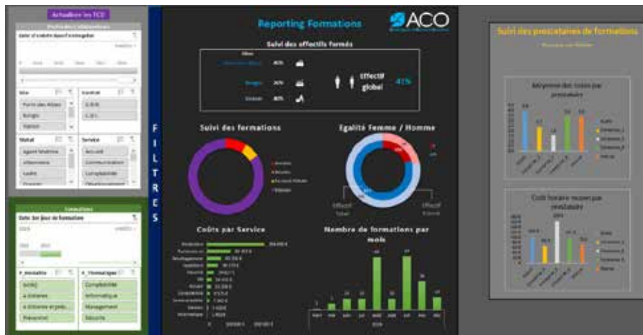
Exemple de tableau de bord construit durant la formation

Maitriser les TCD Maitriser la formule RechercheV Connaitre les segments et la mise en format Tableau