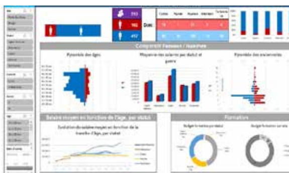
Exemple de tableau de bord construit durant la formation