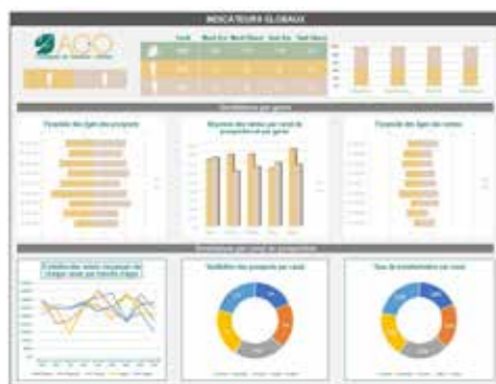
Exemple de tableau de bord construit durant la formation