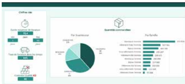
Exemple de tableau de bord construit durant la formation